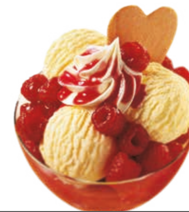
Eis & Heiß mit Himbeeren

Drei Kugeln Eis Vanillegeschmack mit warmen Himbeeren und Sahne. LE